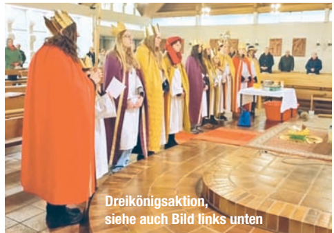
Dreikönigsaktion, siehe auch Bild links unten

Am Karfreitag und Karsamstag ersetzten unsere Minis durch ihr Ratschen die Kirchenglocken. Vielen Dank für den „Osterlohn“ in die Mini-Kasse!