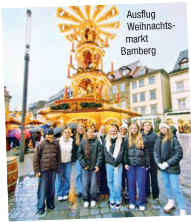
Ausflug Weihnachts- markt Bamberg