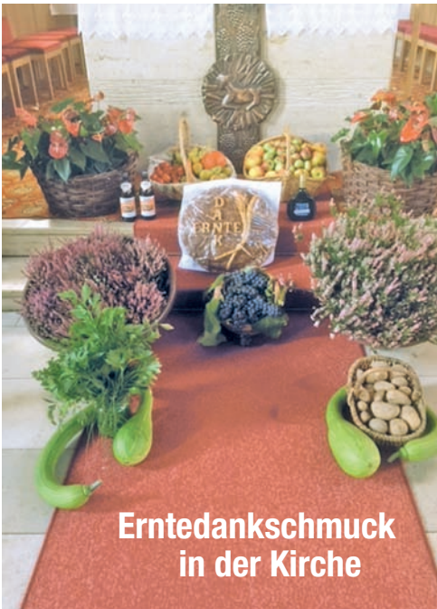
Erntedankschmuck in der Kirche