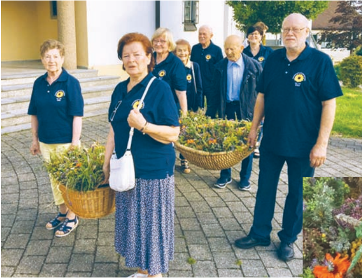
Kräuterweihe zu Mariä Himmelfahrt